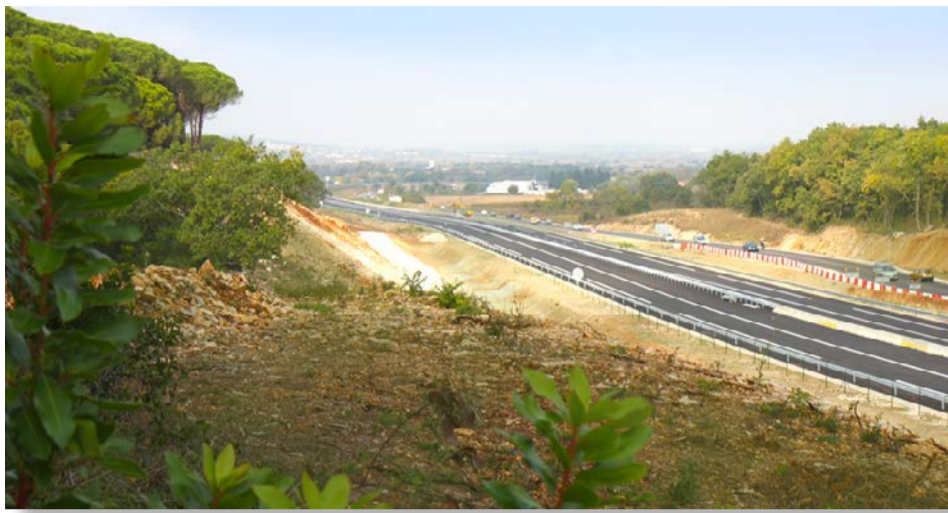
◆ Le contournement de La Calmette

L e tronçon de la RN 106, permettant le contournement de La Calmette, est ouvert à la circulation depuis fin octobre.