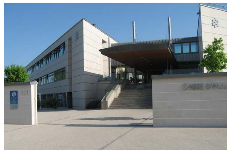
◆ La CAF du Gard

La Caisse d'Allocations Familiales est le service pilote de la lutte aux prestations sociales au sein du Comité Départemental Anti-Fraudes (CODAF) mis en place à l'été 2010 par le Procureur de la République et le Préfet.