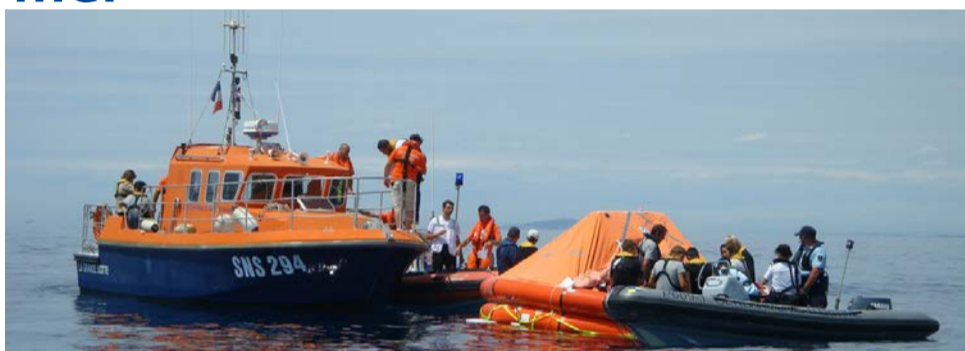
◆ Opérations de secours en mer pendant l'exercice

Un exercice franco-italien de recherche et de secours en mer après le crash d'un avion se déroule au large des côtes du Grau-du-Roi en juin dernier.