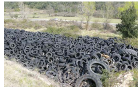
◆ Le dépôt sauvage de pneus

Après plusieurs années de procédures juridique et administrative, selon le principe du pollueur payeur , les sommes nécessaires pour enlever le stock de pneus sont prélevées d'office sur le compte bancaire de l'exploitant.