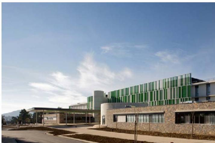
◆ Hôpital d'Alès HQE inauguré le 25 août 2011

la maternité de la clinique Bonnefon à Alès, l'hôpital d'Alès assure l'ensemble des accouchements.