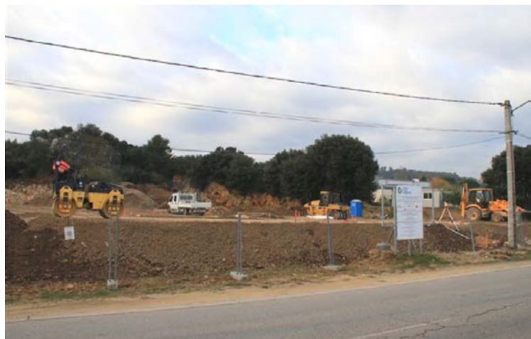
◆ Travaux d'aménagement de l'aire de Bagnols-sur-Cèze

2 aires de grands passages sont prévues à Bellegarde et Pont-Saint-Esprit ainsi que 14 aires d'accueil, soit près de 340 places.