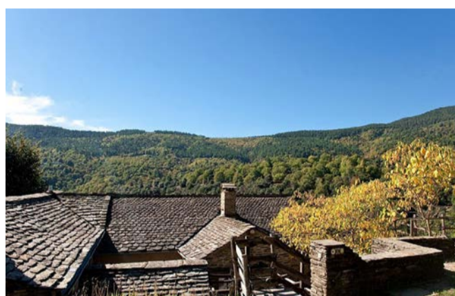
◆ Habitat traditionnel cévenol