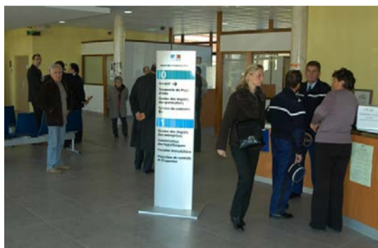
◆ Centre des Finances Publiques à Saint-Priest-des-Vieux

Grâce au regroupement en 2010 des trésoreries et des services des impôts, les contribuables trouvent aujourd'hui, dans un lieu unique , toutes les réponses à leurs questions fiscales, qu'elles portent sur le calcul de l'impôt ou sur son paiement.