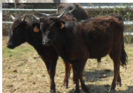
◆ Les animaux 3 mois plus tard