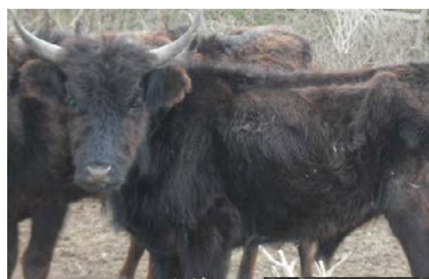
◆ Etat des animaux lors de leur retrait