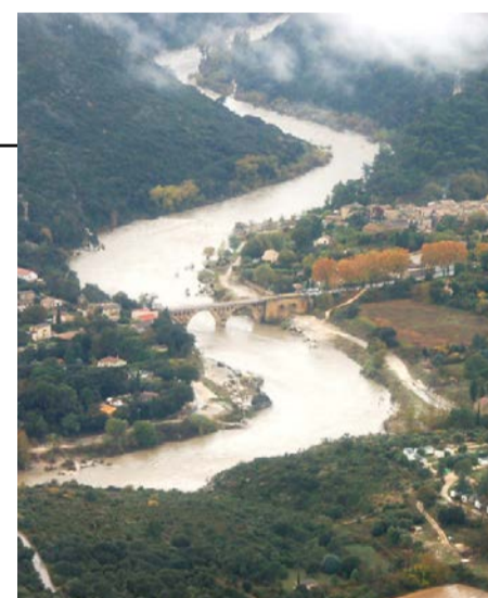
◆ Le Gardon en crue à Collias

L'anticipation du phénomène par Météo-France et le Service de Prévision des Crues permet à la préfecture d'alerter en amont les élus et la population. Aucune victime n'est à déplorer grâce à la bonne coordination des services de l'Etat, du Conseil général, des Maires, de la Croix Rouge française et des opérateurs d'électricité et