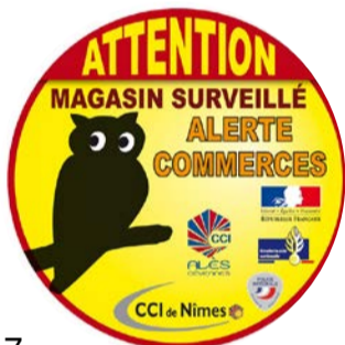
◆ Logo du dispositif apposé chez les commerçants participants

Ce dispositif est porté par les Chambres de Commerce et d'Industrie de Nîmes et d'Alès-Cévennes, la chambre de Métiers du Gard et les associations de commerçants.