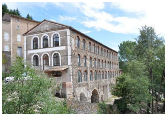
◆ L'ancienne filature d'Aulas, siège de l'association.

Le projet porté par l'Association « Cévennes Valley Numérique » autour des nouvelles technologies de l'information et de la communication devient Pôle d'Excellence Rurale.