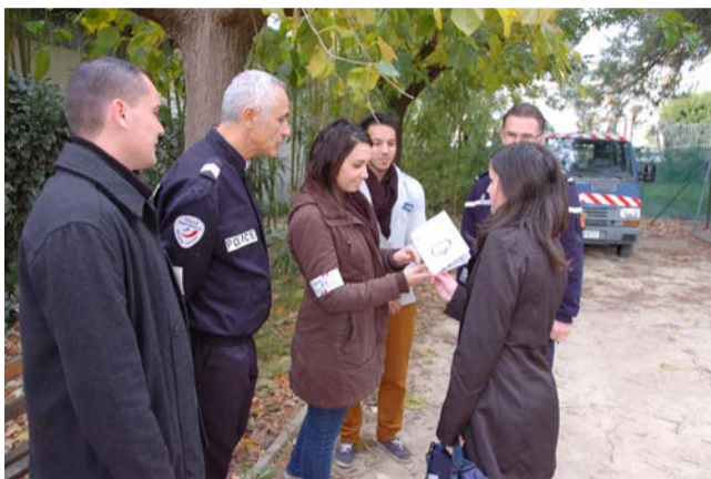
◆ Les jeunes volontaires du service civique

Ce nouveau dispositif permet à tout jeune de 16 à 25 ans d'effectuer une mission d'intérêt général pendant 6 à 12 mois. Durant celle-ci, il perçoit une indemnité mensuelle de l'Etat de 440 € auxquels s'ajoutent 100 € pour ses frais de déplacement et de repas.