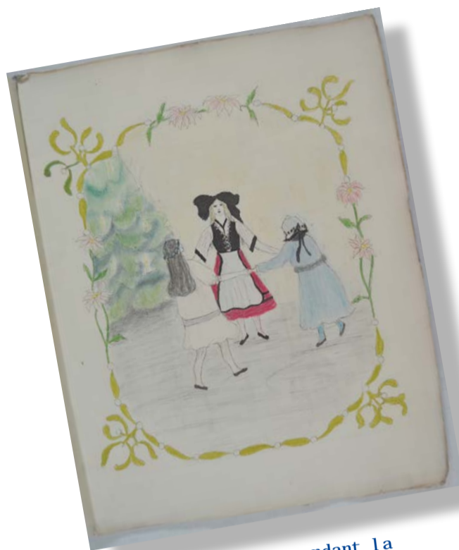
◆ Dessin d'un enfant pendant la Grande Guerre

C omment les Gardois, et notamment les enfants, ont vécu la Première Guerre Mondiale ?