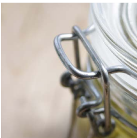
◆ Conserve appertisée

Depuis, aucun nouveau cas n'a été signalé.